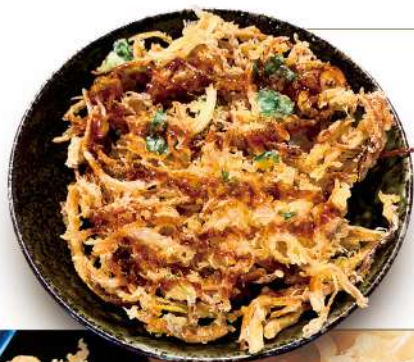
かきあげ丼 750円 税込 ミニサイズ 500円 税込