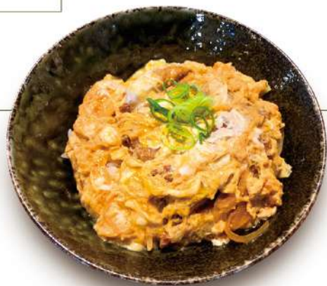
かつ丼 780円 税込 ミニサイズ 530円 税込