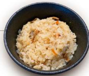
炊き込み ご飯 320円 税込