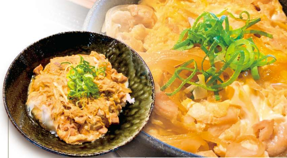
親子丼 750円 税込 ミニサイズ 500円 税込