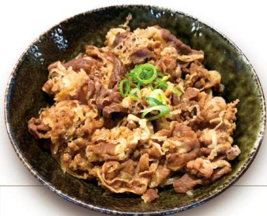
牛めし 770円 税込 ミニサイズ 520円 税込