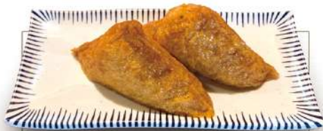
いなり寿司 (2個) 270円 税込