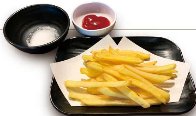
フライドポテト 270円 税込