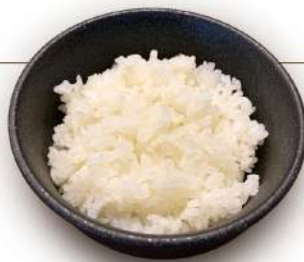
白ご飯 220円 税込