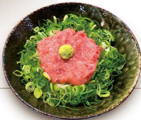
ネギトロ丼 780円 税込 ミニサイズ 530円 税込