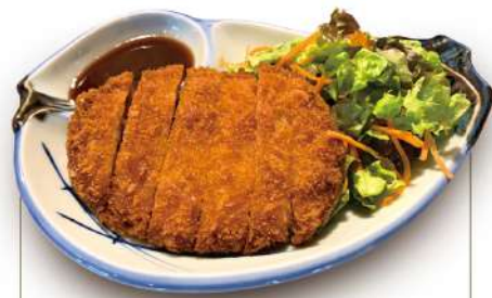
とんかつ 570円 税込